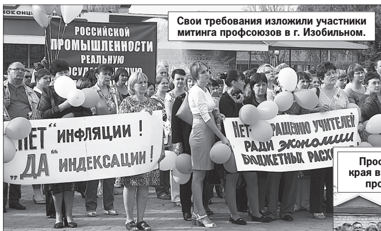
Свои требования изложили участники митинга профсоюзов в г. Изобильном.

Под таким лозунгом Федерация независимых профсоюзов России в рамках Всемирного дня действий «За достойный труд!» 7 октября собрала под свои знамена более 1,7 млн. человек по всей стране. Активное участие во всероссийской акции приняли и ставропольские профсоюзы.