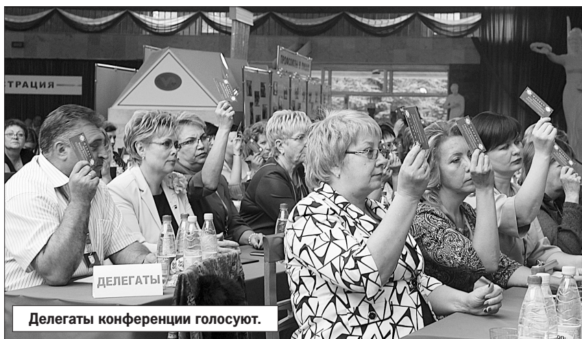
Делегаты конференции голосуют.

ботников учреждений культуры, социального обслуживания, медицинского персонала, не включенного в краевую программу модернизации здравоохранения и др. По инициативе профсоюзов одна из норм трехстороннего соглашения между Правительством Ставропольского края, ФПСК и Конгрессом деловых кругов Ставрополья на 2013 - 2015 годы обязала работодателей-производственников платить своим работникам минимальную заработную плату не ниже прожиточного минимума трудоспособного населения. В результате в 2014 году было доначислено более 39 млн. руб. в пользу 6 тыс. работников, а в первом полугодии текущего года - около 8 млн. руб.