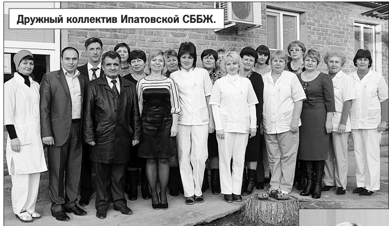
Дружный коллектив Ипатовской СББЖ.

Начали с главного - с коллективного договора. Понимая, что это социальная конституция любой организации, профком из 5 человек посоветовался с трудовым коллективом,