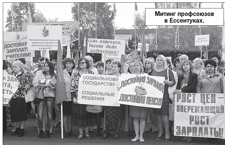
Митинг профсоюзов в Ессентуках.