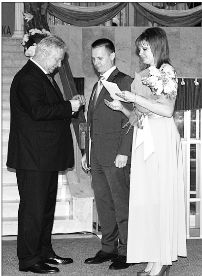
Награждение лучших работников профсоюзных здравниц КМВ.

Слова признательности за их благородный труд высказывали все почетные гости - руководите-