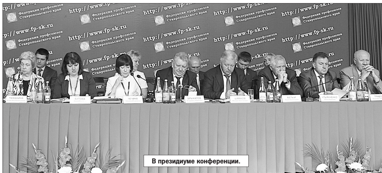
В президиуме конференции.

И, в частности, Федерация профсоюзов СК приложила немало усилий для повышения эффективности системы социального партнерства, в которой видит основу для объединения усилий всех заинтересованных сторон в решении социально-экономических проблем региона. Используя в качестве основного инструмента своего влияния площадку краевой трехсторонней комиссии по регулированию социально-трудовых отношений, профсоюзная сторона даже в условиях жесткого бюджетного дефицита добивалась выделения дополнительных средств на повышение оплаты труда наиболее уязвимых в социальном плане воспитателей детских садов, ра-