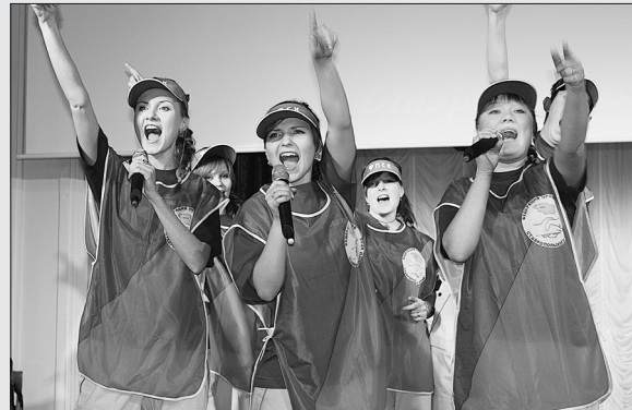
Профсоюзная агитбригада студентов Ессентукского филиала СГПИ (2013 год).

Федерация профсоюзов Ставропольского края объявила краевой смотр-конкурс молодежных профсоюзных агитбригад «Профсоюз действует!».