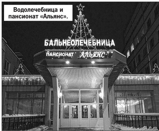
Водолечебница и пансионат «Альянс».

На вопрос, насколько это реально финансово, имея в виду, что профсоюзы, будучи социально ориентированными собственниками, при этом никаких льгот не имеют, получила ответ: