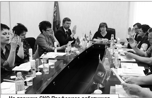
На пленуме СКО Профсоюза работников химических отраслей промышленности.

- Мы должны предложить современный, передовой опыт, новые технологии подготовки профактивистов, - заявила профсоюзный краевой лидер