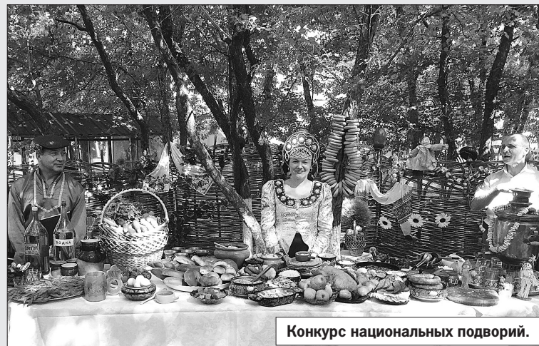
Конкурс национальных подворий.

Основательно зарядившись положительными эмоциями при проведении для них большой развлекательной программы, наиболее активные рыбаки уже вечером