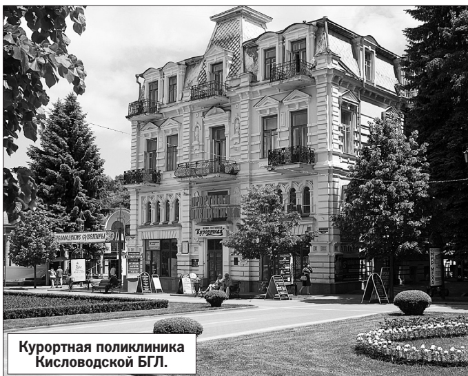
Курортная поликлиника Кисловодской БГЛ.

Отдельно следует отметить, что в составе бальнеогрязелечебницы функционируют 2 общекурортных питьевых бювета - №№ 5 и 23, подающих всем желающим (причем бесплатно и ежедневно с утра до вечера!) чудодейственные сульфатные и доломитные нарзаны, которые по своим вкусовым качествам и газонасыщенности - самые популярные в Кисловодске.