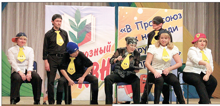
Победитель профсоюзного КВН - команда Центра образования г. Ставрополя «Беспредел».

Завершается 2015 год, объявленный ЦК Профсоюза работников народного образования и науки Годом молодежи. Он был богат юбилеями: 70-летие Великой Победы, 110-летие российских профсоюзов, 25-летие ФНПР и Общероссийского профсоюза народного образования и науки РФ. Отпраздновала 20-летний юбилей и Ставропольская городская организация Профсоюза. Завершить богатый на знаменательные даты год горком Профсоюза решил проведением профсоюзного КВН во Дворце культуры им. Гагарина.