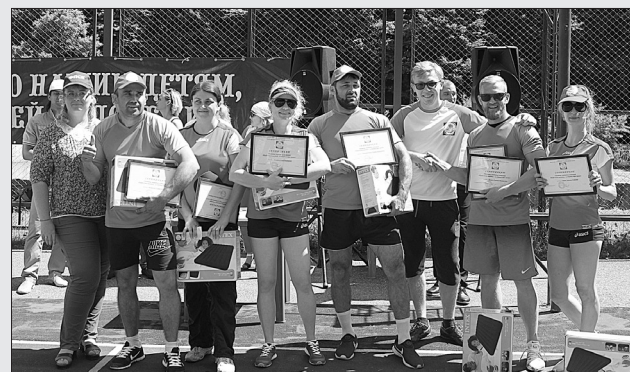
Лидер соревнований - сборная команда молодых профактивистов Советского муниципального района.

Под таким девизом в канун Дня молодежи России на Комсомольском озере г. Ставрополя прошел спортивный праздник, инициатором которого выступил Молодежный совет Федерации профсоюзов Ставропольского края. В мероприятии приняли участие более 100 представителей работающей и студенческой профсоюзной молодежи в составе 16 команд со всего края.