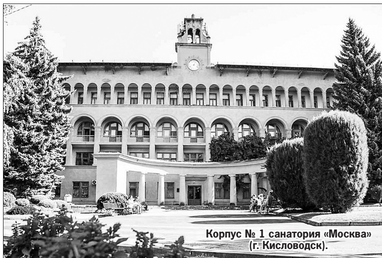
Корпус № 1 санатория «Москва» (г. Кисловодск).

О ней сегодня модно поговорить. Профсоюзные здравницы Кавминвод не рассуждают, а без пафоса и громких слов уже почти 100 лет, невзирая ни на какие социально-экономические пертурбации, выполняют задачу массового оздоровления россиян. Ориентируя свою ценовую политику на доступность для населения, они в составе ООО «Курортное управление» (холдинг) г. Кисловодск являются крупными налогоплательщиками региона, содержат объекты инфраструктуры, культурные памятники, бюветы с бесплатной минеральной водой для всех желающих, участвуют в благотворительных программах городов-курортов. Одним из таких санаторно-курортных учреждений профсоюзов является санаторий «Москва» (г. Кисловодск), который недавно отметил свое 65-летие.