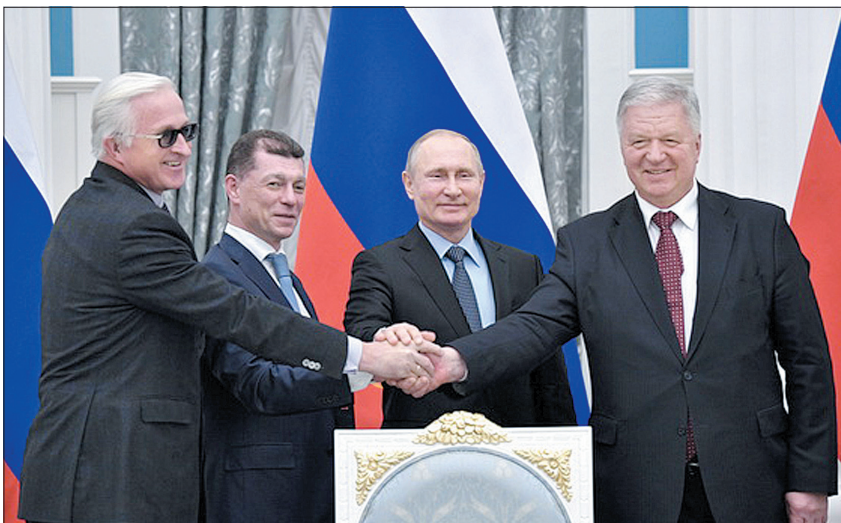
Президент РСПП А. Шохин, министр труда и социальной защиты РФ М. Топилин, Президент РФ В. Путин, председатель ФНПР М. Шмаков на церемонии подписания Генсоглашения.

29 января в Кремле состоялось подписание Генерального соглашения между общероссийскими объединениями профсоюзов, общероссийскими объединениями работодателей и Правительством Российской Федерации на 2018 - 2020 годы.