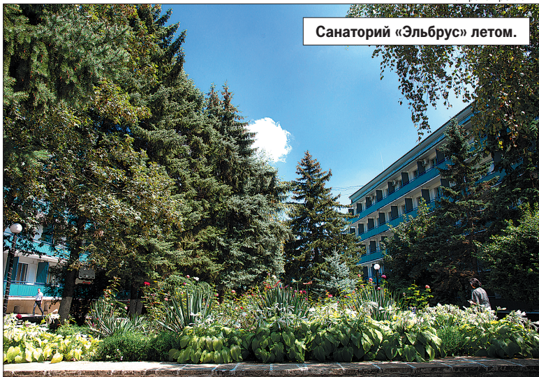
Санаторий «Эльбрус» летом.

блем с загрузкой, а 60% отдыхающих - его постоянные клиенты, приезжающие сюда не один год подряд.