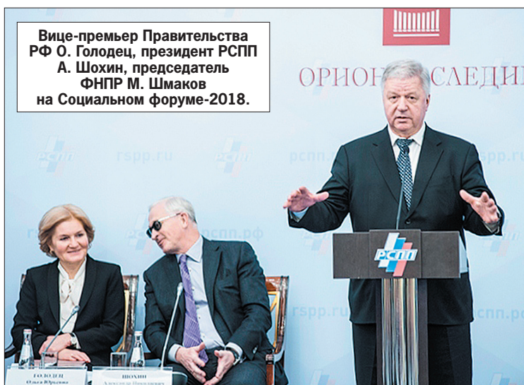
Вице-премьер Правительства РФ О. Голодец, президент РСПП А. Шохин, председатель ФНПР М. Шмаков на Социальном форуме-2018.

Заместитель председателя Правительства РФ О. Голодец назвала знаковым событием решение главы государства о повышении минимального размера оплаты труда, подчеркнув, что оно затронет 3 млн. человек, из которых 1,6 млн. заняты в государственных и муниципальных учреждениях. При этом она призвала работодателей воспользоваться этой возможностью для замены неквалифицированных рабочих мест на высокотехнологичные. Второй важный аспект повышения МРОТ, по ее словам, - поддержка доходов населения, поскольку сейчас они «являются основным