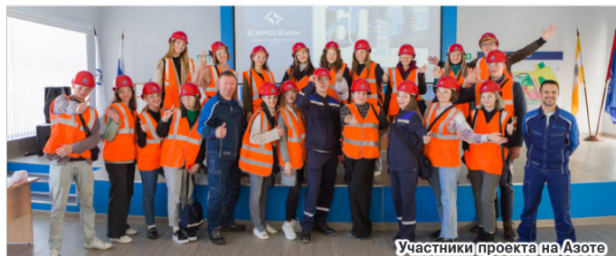
Участники проекта на Азоте