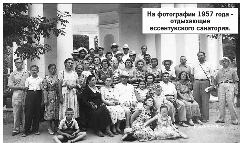
На фотографии 1957 года - отдыхающие эссентукского санатория.

Когда начался процесс разграничения прав собственности между государством и профсоюзами, руководство ФНПР и ФПСК вместе с руководителями наших учреждений сделали все возможное, чтобы не только сохранить санаторно-курортный комплекс профсоюзов, но и обеспечить его нормальное функционирование. Да, это была порой невозможная сложная работа, мы практически жили на Кавказских Минеральных Водах. Несмотря на давление разных госкомиссий, удалось поднять из архивов правоустанавливающие документы, подтверждающие вложение профсоюзных средств в тот или иной объект. Сегодня я горжусь тем, что наш санаторно-курортный комплекс на КМВ - один из крупных и динамично развивающихся участников рынка санаторно-курортных услуг региона. Он даже в рыночных условиях продолжает традиции массового оздоровления россиян, ориентирует свои услуги на доступность для населения, ведет большую социальную и благотворительную работу, содержит общекурортные объекты. Кстати, программу ФНПР «Профсоюзная путевка» с 20%-ной скидкой ее стоимости для членов профсоюзов инициировали именно наши, ставропольские, здравницы. Жаль только, что, участвуя в государ-