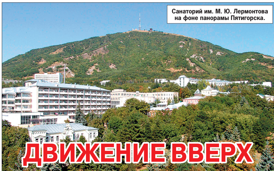
Санаторий им. М. Ю. Лермонтова на фоне панорамы Пятигорска.

Эта уникальная технология, для реализации которой была приобретена целая линия специальных тренажеров, позволяющая посредством сочетания природных бальнеологических факторов и возможно-